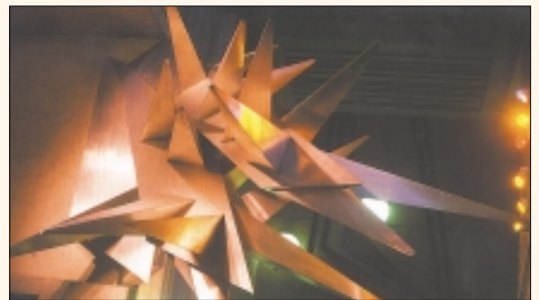
Station De la Savane

Artiste autodidacte originaire de Valleyfield, Maurice Lemieux (1931-1994) ressentait le besoin de créer des formes élégantes et gracieuses. Ses recherches artistiques firent de lui un expert dans de multiples matériaux et il inventa à l'occasion des outils spéciaux en rapport avec ses besoins. Ses réalisations peuvent être admirées dans de nombreux lieux publics, notamment à la station de métro De la Savane. Sous le plafond cathédrale de cette station à l'allure futuriste, Maurice Lemieux a conçu une gigantesque sculpture intitulée Calcite . Le jour, les rayons du soleil frappent les facettes des éléments en acier inoxydable, acheminant la lumière vers les extrémités de la mezzanine. La nuit, les éléments de la sculpture vibrent de coloris différents à intervalles réguliers grâce à des sources d'éclairage artificiel de trois couleurs, insérées dans le puits de lumière de la station. Une autre sculpture en acier inoxydable de l'artiste, Enterspace , a été dévoilée devant un des accès de la station de métro Peel en juillet 1981.